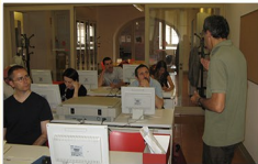
Un momento del corso di formazione all'uso di Archos

Il sistema integrato dei cataloghi d'archivio Archos – progettato e utilizzato all'interno dell'Istoreto dal 2004 – sarà utilizzato dagli Istituti storici della Resistenza aderenti all'Insmli (Istituto nazionale per la storia del movimento di liberazione in Italia) e dall'Insmli stesso per la gestione dei propri patrimoni archivistici. Il lavoro sta coinvolgendo in forma sperimentale diversi Istituti della Resistenza.